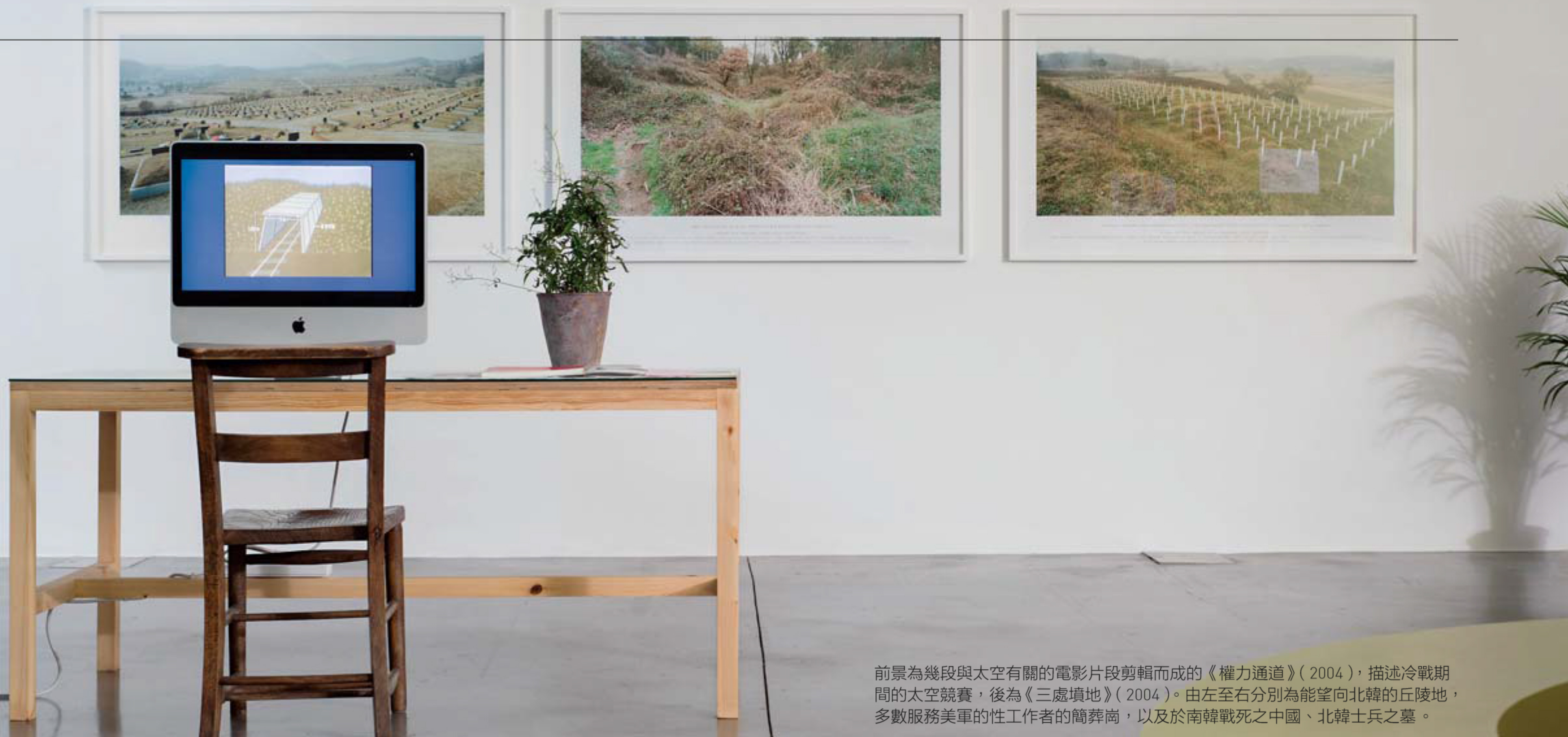
前景為幾段與太空有關的電影片段剪輯而成的《權力通道》(2004)，描述冷戰期間的太空競賽，後為《三處墳地》(2004)。由左至右分別為能望向北韓的丘陵地，多數服務美軍的性工作者的簡葬崗，以及於南韓戰死之中國、北韓士兵之墓。

當我們說起個展，總是關於一個人的。但在概念層次上，一個個展終究涉及多少人的參與？而我們展出一個圖像時，究竟是多少人正在被展示？