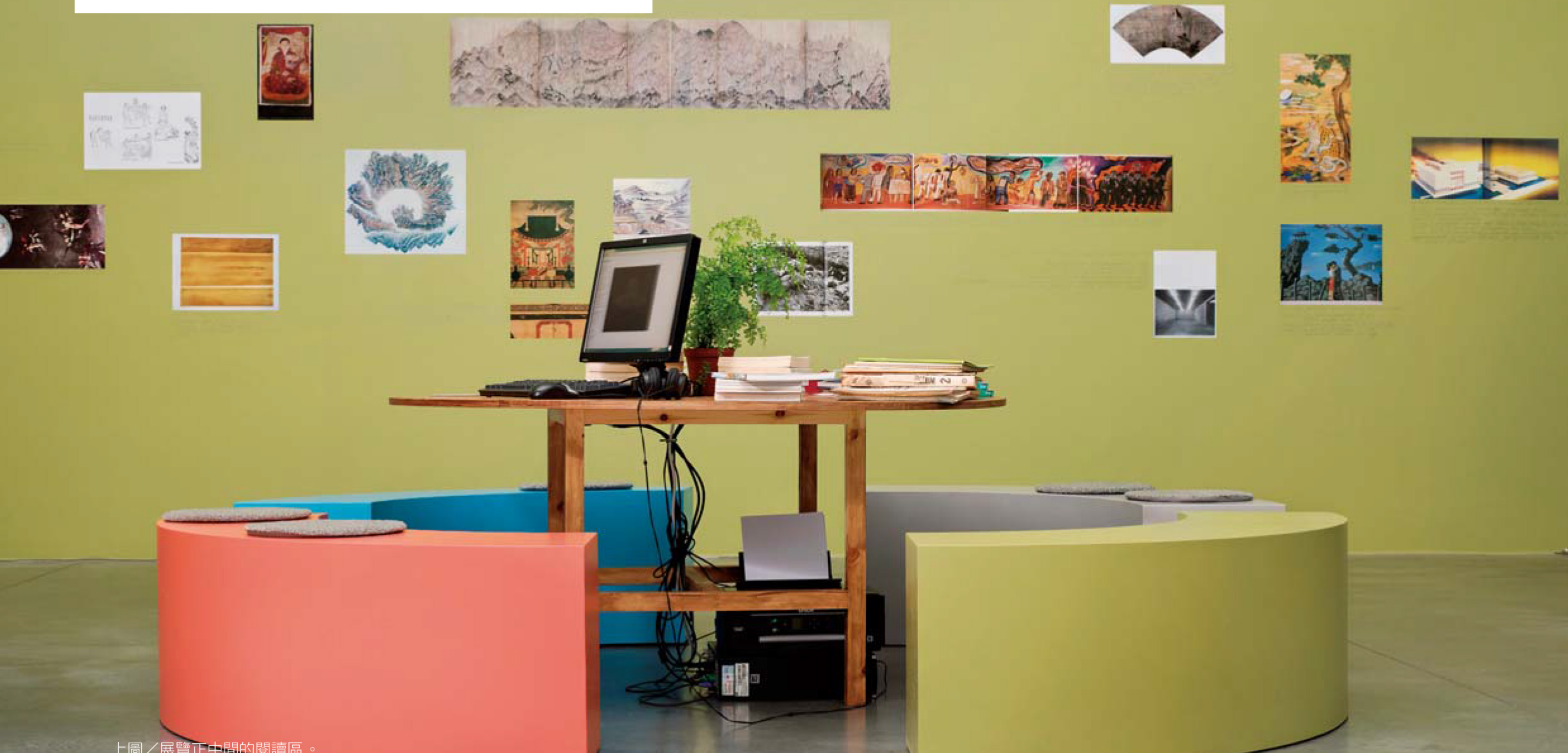
上圖／展覽正中間的閱讀區。