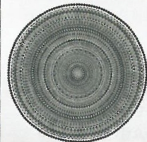
바티 커, 'Square a circle 3'

‘가정’, ‘전통’, ‘여성’ 등을 주제로 한 대형 조각 작품도 선보여왔다. 거대한 문이 집 안으로 쓰러지는 것 같은 ‘Time Lag’와 검은색 유리 섬유로 빛은 여성상 ‘Cloud Walker’는 아름다우면서도 기괴한 느낌이 든다. 전통적으로 인도에서 집은 여성의 공간이다. 가정은 여성이 자아를 확인할 수 있는 유일한 장소였다. 하지만 이곳에 안락함과 평화로움만 있는 것은 아니다. 가족과 가정은 ‘보호’라는 명목 아래 여성의 유연한 사고를 위협할 만한 제약들을 만들어왔다. 내가 가정을 아름답게만 표현하지 않는 이유다.