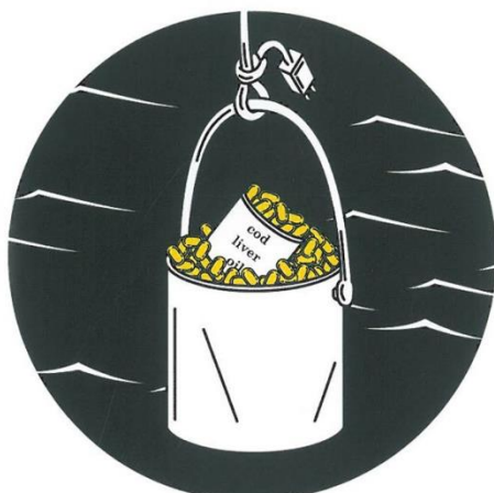
張騰遠，《逃生至地球： 一百種在地球上的生存方法》。