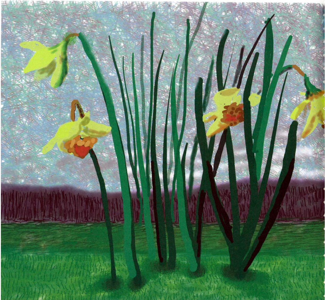
David Hockney, <Do remember they can't cancel the spring>, 2020. Courtesy the Artist and Louisiana Museum of Modern Art