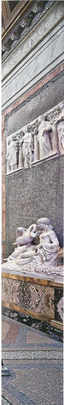
《빌라보르게세 로마 XIII 2012》 C-프린트 184×204.6cm_로마 보르게세공원 안에 위치한 이 미술관, 본래 17세기 카라발리오와 베르니니의 후원자였던 시피오네 보르게세 추기경의 개인 저택이자 소장품 전시실이었다. 회퍼는 말한다. “이러한 장소는 내면의 깨우침을 위한 공간일 뿐 아니라, 과시하고 칭송 받아 마땅한 ‘계몽’이 일어나는 공간이다.”

국제갤러리에서 열리는 칸다다 회퍼의 개인전 〈깨달음의 공간〉은 독일 이탈리아 프랑스 아르헨티나 등지에서 촬영한 공연장, 도서관, 전시장 이미지를 선보인다. 이러한 공간은 문화를 경험하기 위해 사람들이 모여드는 곳이다. 또한 지식을 쌓고 의견을 나누는 등 서양사회에서 배우고, 이해하고, 개인의 지적 자아를 점진적으로 육성하는 데 필요하다고 여기는 모든 행위와 관련된 장소다. 깨달음, 깨우침 또는 계몽이라 번역하는 ‘Enlightenment’는 17~18세기 서구 계몽주의의 핵심개념으로, 지식과 정보를 축적만 해서는 얻을 수 없고 이성과 비판적 사고를 통해야만 도달할 수 있는 상태를 말한다. 회퍼는 공연, 전시, 독서 공간을 아울러 ‘깨달음의 공간’이라 칭함으로써, 지식과 문화의 향유가 우리의 인식을 변화시키고 깨달음의 경지로 이끌어준다고 강조한다.