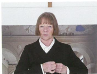
칸다 회퍼 / 1944년 독일 에베르스발데 출생. 필름 베르크슐레에서 예술, 사진 전공. 뒤셀도르프아카데미 영화과, 사진학과 졸업. 유럽 및 미주, 아시아 주요기관에서 다수 개인전 및 단체전 개최. 제11회 카셀도쿠멘타(2002), 제50회 베니스비엔날레(2003) 독일관 대표. 소니세계사진상 사진공로상 수상(2018). 현재 필름에서 활동 중

칸다 회퍼가 인간과 공간의 상호작용을 사색하는 방식은 아이러니하다. 공간을 소재로 삼지만, 사람이 부재한 순간을 포착하기 때문. 이것 역시 회퍼 작업의 중요한 특징이다. 초기작 이후로 그의 화면에서 사람은 점차 사라지고 공간 그 자체만 가득 나타났다. 역설적으로 정적이고 고요한 모습은 공간에 머무른 이들과 사물의 쓰임새를 강렬하게 인식하도록 만든다. 부재를 통해 확인되는 존재의 숙명. 이미지 속 텅 빈 의자와 책상은 그곳에 앉아있는 사람들을 상상하게 하고, 이미지 너머의 관객에게 이곳으로 들어와 앉아보도록 권유한다. 그것은 또한 작품을 해석하는 지평을 여는 일이기도 하다. 관객에게 본인의 시각이나 해석을 강요하고 싶지 않다는 작가는 그들이 자기 뜻대로 생각하고 상상할 자유가 있다고 말한다. 작가가 아닌 관객으로서 자신의 작품을 볼 때, 어떤 느낌을 받는지 궁금했다. “이미지 속 공간에 다시 들어갈 수 있도록 나를 초대하는 느낌이 들어요.” 하지만 회퍼는 이미 촬영한 장소보다는 새로운 ‘깨달음의 장소’를 찾는 일에 더 신이 나는 듯하다. “제 호기심은 과거보다는 미래를 향합니다. 물론 이미 다녀온 곳에 엄청난 변화가 있었다는 소식을 들으면 때로는 다시 가보고 싶기도 해요. 그러나 대개 저는 앞을 내다보고 다음 일을 궁금해하죠. 바로 이것이 저를 움직이는 동력입니다.”