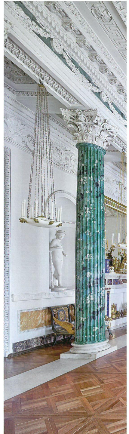
〈파블롭스크궁 파블롭스크 III 2014〉 C-프린트 184×221.9cm_18세기 예카테리나 대제의 명으로 지은 옛 러시아 황궁. 상트페테르부르크 남부 파블롭스크에 있다. 녹색 대리석으로 만든 코린트식 기둥이 늘어선 이 공간은 공식 접객실이었던 그리스식 홀이다. 작가는 커다란 창문을 통해 쏟아져 들어온 자연광과 상들리에 조명을 이용했다.

영속의 시간을 담은 듯한 그의 작품은, 본능과 순간의 행운이 깃든 결과물이기도 하다. "공간을 탐색한 뒤 어디서 무엇을 찍을지 이제는 직감으로 느낍니다. 공간이 대중에게 개방되지 않는 제한된 시간 내에 얼른 촬영을 마쳐야 하니까요. 공간이 이야기하는 바를 듣는 능력을 최대한 발휘해야 해요. 공간 그 자체와 공간 속 여러 사물이 말하는 바에 의존하죠." 촬영시간은 짧지만 최종 결과물을 내기까지 더 많은 시간을 할애한다. "저는 보통 촬영 후 상당한 시간이 흐른 뒤에야 인화해요. 그리고 나서 처음으로 공간과 이곳에 내재한 특징을 사색해보는 시간을 갖습니다. 이 때 조명과 분위기는 매우 중요하죠. 때때로 공간의