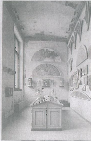
'베를린 노이에 미술관'