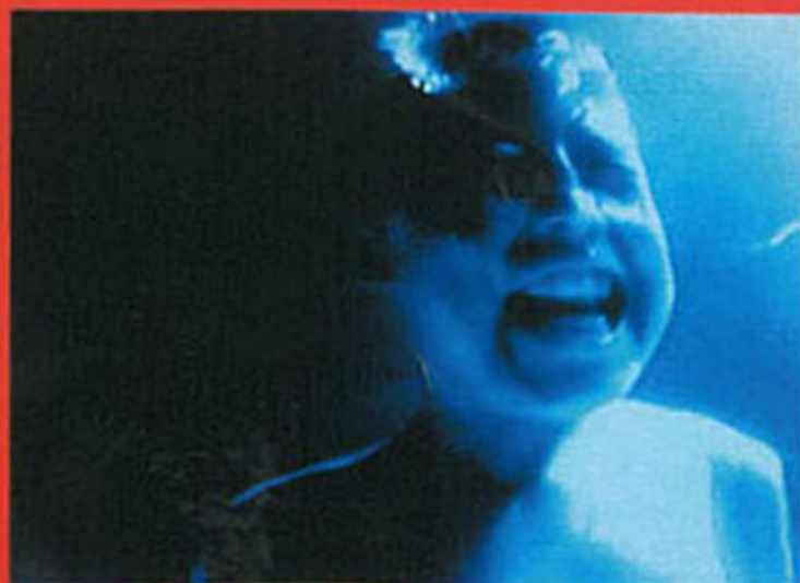
〈Ancient of Days〉 싱글채널 컬러 비디오 12분 21초 1979-1981 오른쪽 페이지 · 〈Tristan's Ascension〉 4채널 비디오 10분 16초 2005