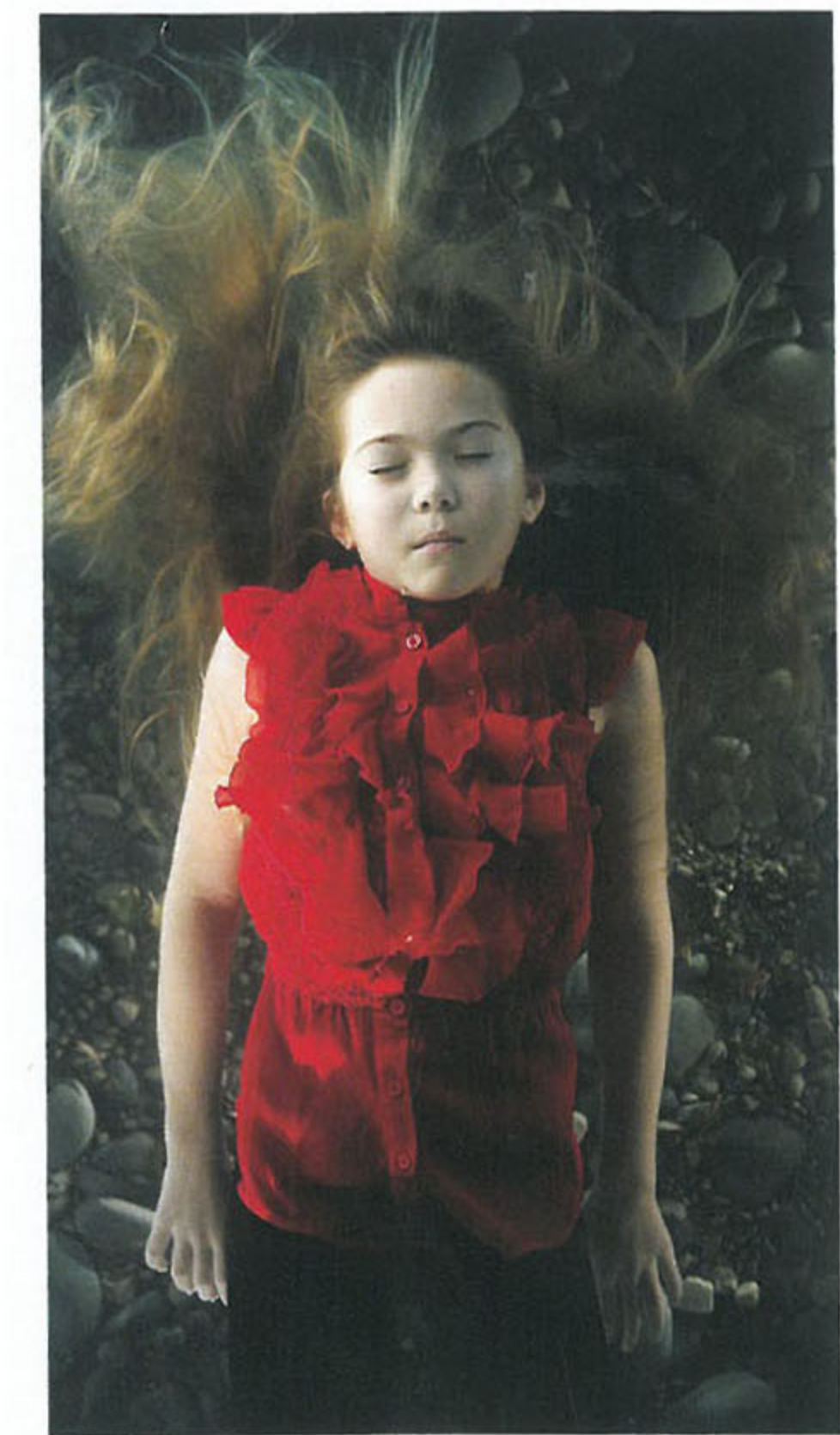
<The Dreamers> 7개 비디오 중 부분 2013 오른쪽 페이지 왼쪽 · <Chott el Djerid> 컬러 비디오 테이프 28분 1979 / 오른쪽 · <The Reflecting Pool> 컬러 비디오 7분 1977-1979

비올라에게 비디오이미지는 어떤 경계 또는 어떤 간격으로 기능한다. 이 ‘거울 연못’의 수면을 경계로 삼아 그것 위의 외부세계와 그것 아래의 내부세계가 구별되지만, 이 수면 자체는 외부세계에도 내부세계에도 속하지 않는다. 비올라는 경계로서의 비디오이미지를 ‘사이 공간(space between)’이라고 일컫는다. 그는 1994년의 한 노트에서 자신의 작업이 “잠과 깨어남 사이의 장소, 의식과 무의식의 접경지대, 정상적인 구별과 확실한 경계가 와해되어 현실과 상상의 경계선과 대상과 연상의 경계선이 희미해지는 곳”에 위치한다고 말한다. 즉 그는 비디오야말로 온갖 이항대립—잠과 깨어남, 삶과 죽음, 의식과 무의식, 실재와 가상, 과거와 현재 등—의 어느 한편에도 속하지 않으면서 그 양편의 구별을 가능하게 만드는 ‘사이 공간’을 시각적으로 드러낼 수 있는 장치라고 생각한다. 그리고 비디오를 통해 그 ‘사이 공간’에 대한 미학적 탐구를 지속한다. 그런데 어떤 점에서 비디오가 이 비가시적인 경계나 간격을 가시화할 수 있는 장치인가?