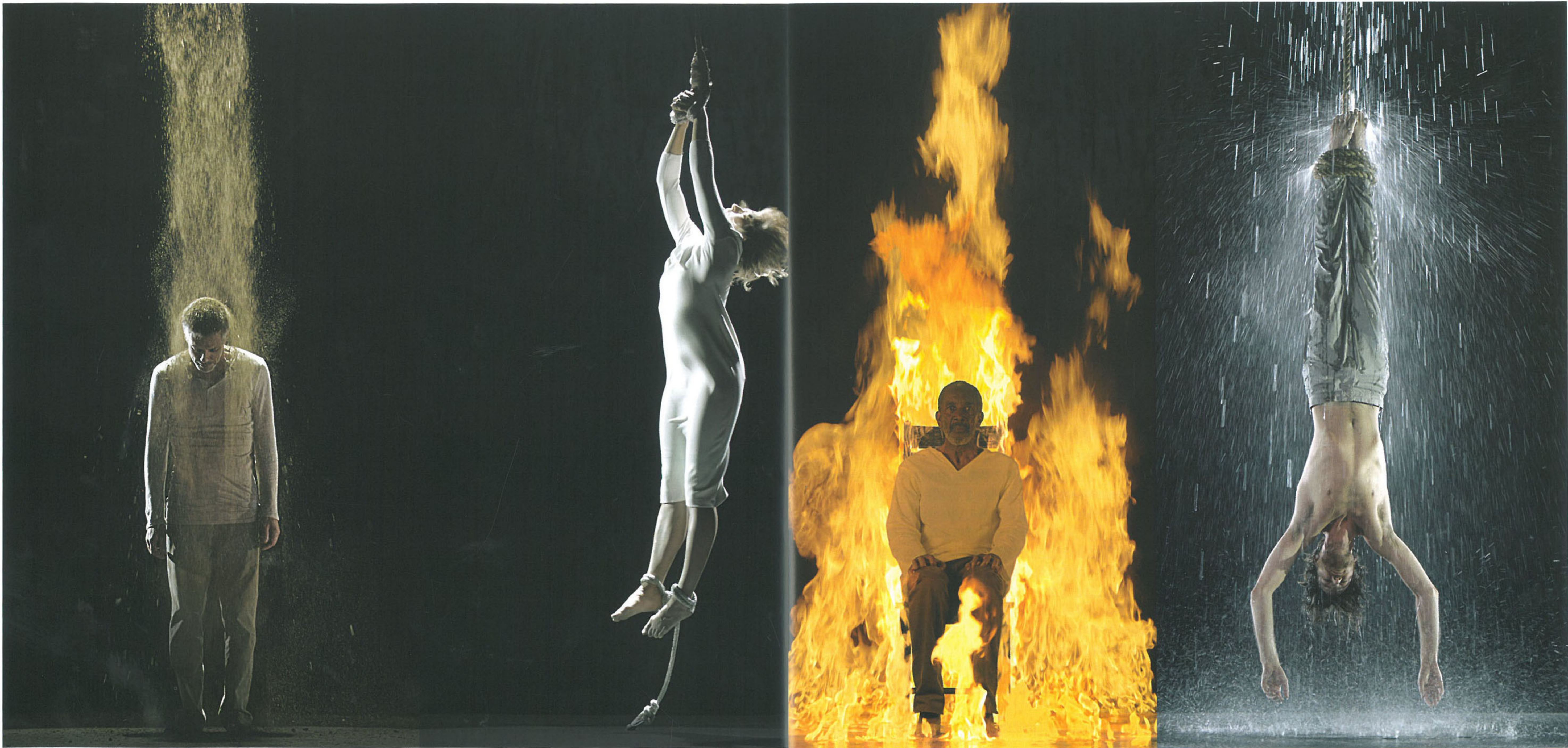
〈Martyrs(Earth, Air, Fire, Water)〉 4개의 수직 플라즈마 디스플레이에 고화질 비디오 140×338×10cm 7분 15초 2014_런던 세인트폴 대성당 설치 전경 이전 페이지 왼쪽 · 〈The Veiling〉 9개 스크린에 투사한 2채널 컬러 비디오 30분 1995 / 오른쪽 · 〈Heaven and Earth〉 마주 보고 있는 2개의 모니터에 2채널 흑백 비디오 1992