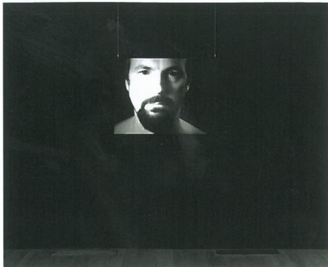
<불멸을 성취하기 위한 아홉 번의 시도> 싱글채널 비디오 18분 13초 1996 오른쪽 페이지 · <경악의 5중주> 싱글채널 컬러 비디오 15분 20초 2000

결국 비올라가 비디오를 통해 확보한 사이 공간은 모든 기존의 이항대립들이 물러서는 장소이며, 서로 이질적인 대상들이 모순 없이 긴장 관계를 형성하며 고유한 리듬으로 순환하는 장소이다. 이것은 어쩌면 전혀 새롭지 않은 이야기일 수 있다. 인간 실존을 비롯해 운동하고 변화하는 세계의 모든 사물들은 이미 어떤 절대적이고 본질적인 대립이나 모순 없이 서로 고유한 리듬의 순환주기에 따라 상승과 하강의 파토스를 발산하고 있는지도 모른다. 즉 비올라의 사이 공간이란 사실 세계 내 존재가 처음부터 머물러 온 터전일지도 모른다. 그러나 비올라는 비디오의 슬로모션 기법에서 출발해 이 ‘변환’ 사실을 예술적 사유의 대상으로 변형시킨다. 이 변형은 아무런 변형이 없는 자기모순적인 변형이다. 우리는 이런 기이한 사건을 ‘변용(transfiguration)’이라고 부른다. 변용이란 아무런 물리화학적 변형 없이도 포도주가 구세주의 피가 되고 빵이 구세주의 살이 되는 사건이다. 비올라의 사이 공간에서 시도되는 이 사건은 모든 사물을 본연의 모습 그대로 나타나게 만든다. 그때 사물은 ‘무한’의 지위를 얻는다. “만일 지각의 문이 열린다면 모든 것은 인간에게 그것 본연의 모습으로, 즉 무한으로 나타나리라.”(윌리엄 블레이크)