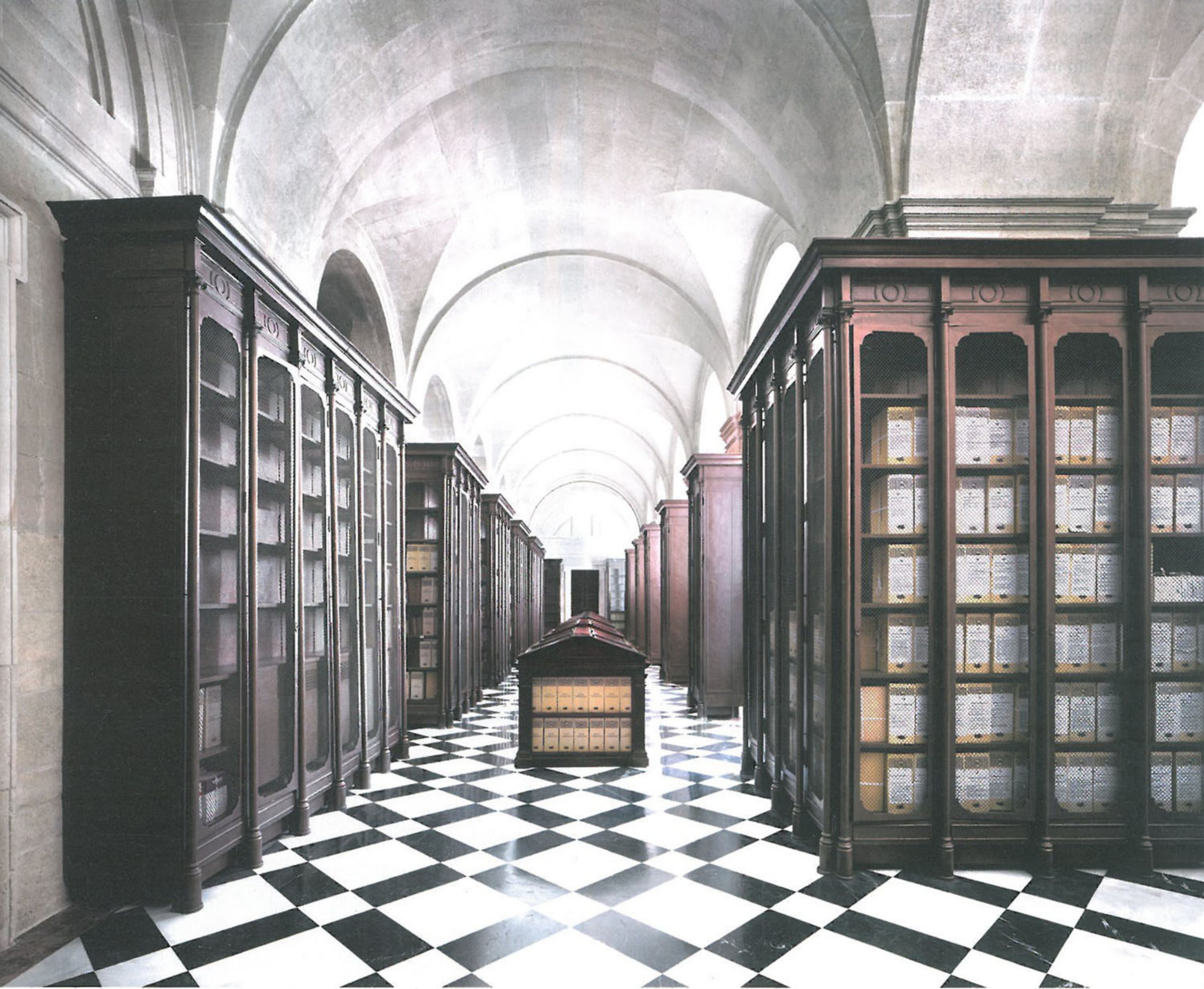
"Archivo General de Indias Sevilla I" 2010, 200×248.4cm © Candida Höfer, Köln / VG Bild-Kunst, Bonn