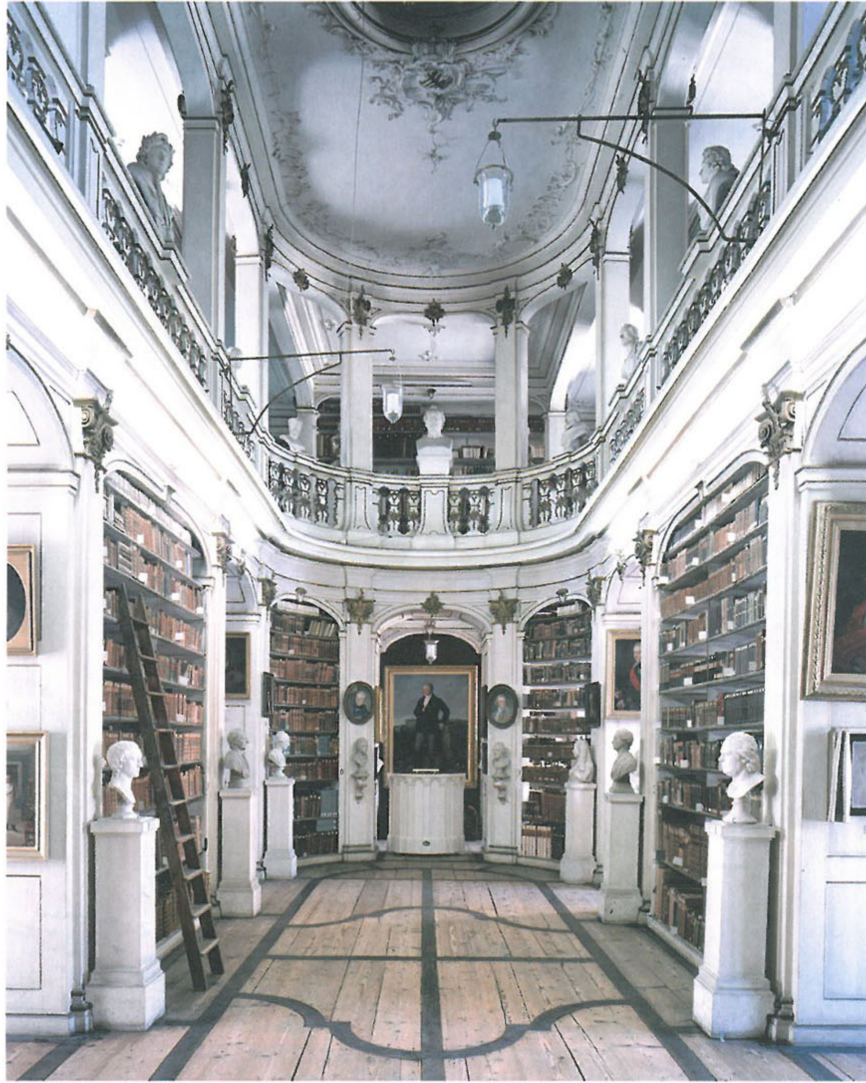
"Herzogin Anne Amalia Bibliothek Weimar II" 2004, 222x180cm © Candida Höfer, Köln / VG Bild-Kunst, Bonn

"What interests me the most in the spaces I choose for my photographs, as for example libraries, is the order: the order of the tables, the order of the chairs, the shelves and the arrangement of books on each shelf."