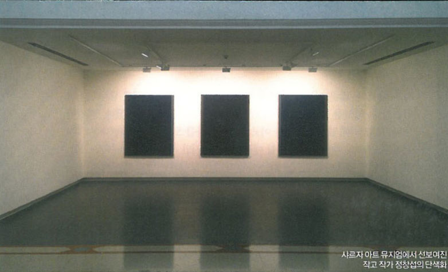
샤르자 아트 뮤지엄에서 선보여진 작고 작가 정창섭의 단색화