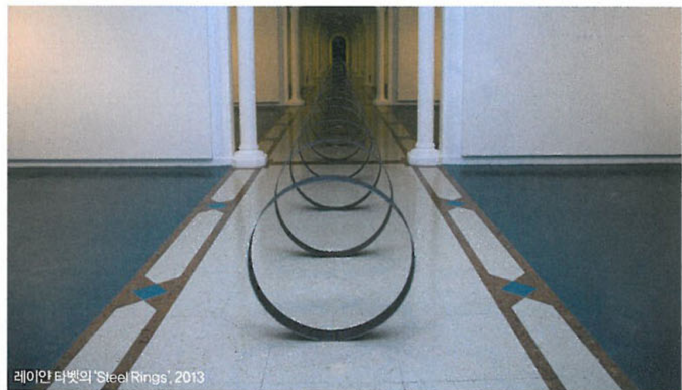
레이안 타벳의 'Steel Rings', 2013