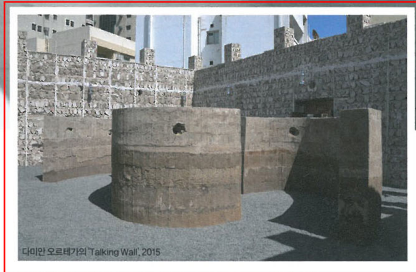
다미안 오르테가의 'Talking Wall', 2015