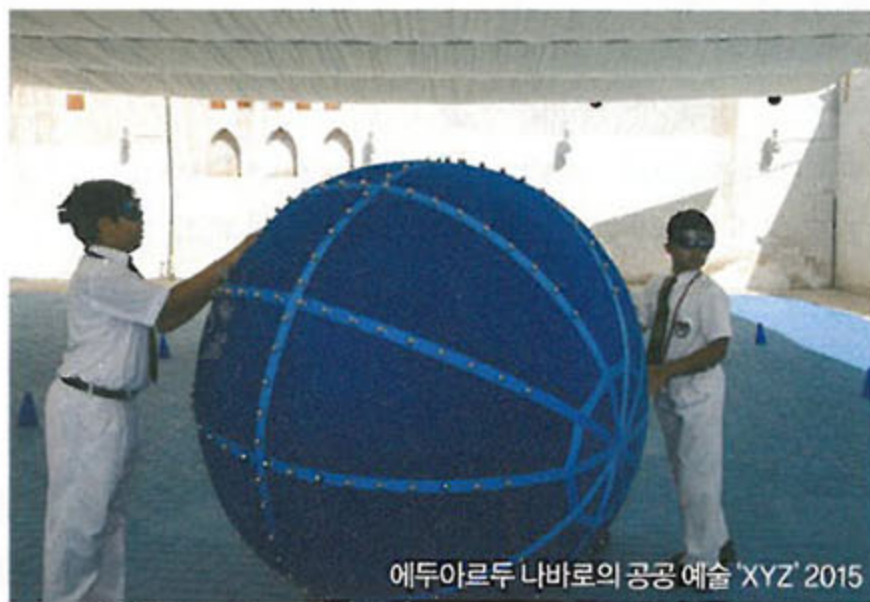
에두아르두 나바로의 공공 예술 'XYZ' 2015