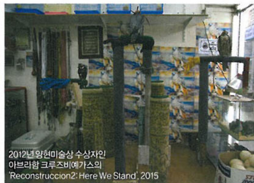
2012년 양현미술상 수상자인 아브라함 크루즈비예가의 'Reconstrucion2: Here We Stand', 2015

머물며 '장소특정적'인 작품을 고민했다. 샤르자 비엔날레는 예술 관련자들은 물론 연구기관과 학자들과의 커뮤니케이션까지 적극 주선하며 도시의 크고 작은 '현재'를 피상적이지 않게 담아내도록 후원했는데, 참여 작가들은 이 과정에 상당한 만족감을 표했다. 양혜규도 마찬가지였다. "도시계획학자, 고고학자 등에게 이곳의 전통 건축에 대해 배운 적도 있어요. 다른 작가들과 토론하고, 워크숍 하고, 영화 보고, 퍼포먼스 보고, 프레젠테이션 듣고, 답사가 고... 이런 과정들이 굉장히 흥미로웠어요."