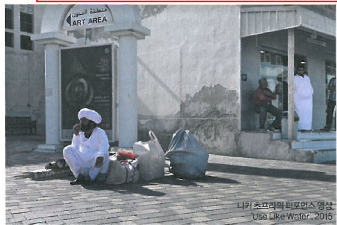
니키 초프라의 퍼포먼스 영상 'Use Like Water', 2015