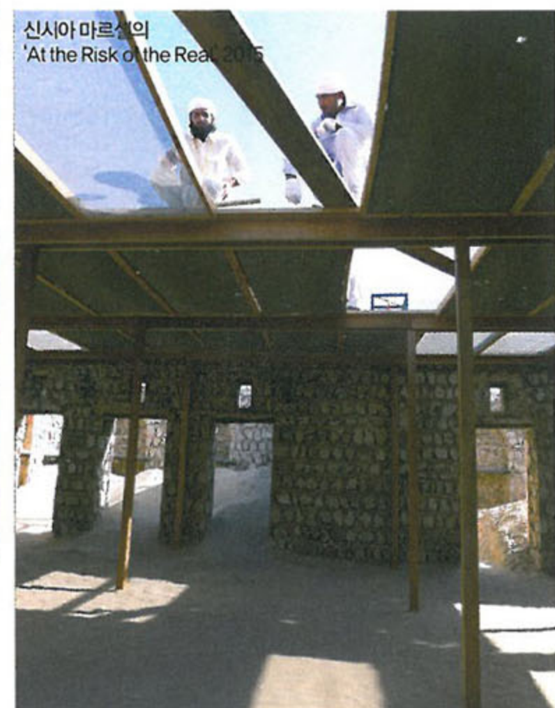
신시아 마르셀의 'At the Risk of the Real', 2015