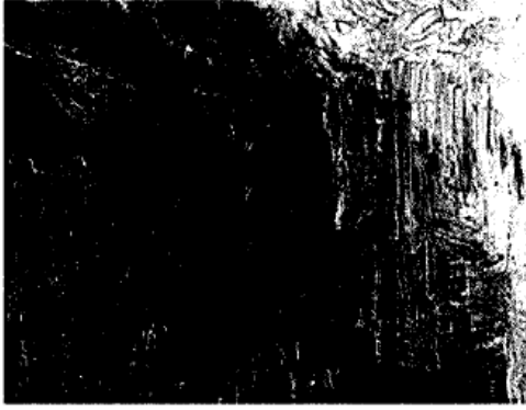
A sinistra una delle opere di Cy Twombly in mostra a Ca' Pesaro. A destra l'artista australiano Harry Newell al lavoro sulla sua installazione nelle Corderie dell'Arsenale.