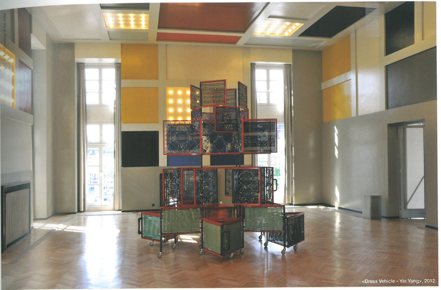
<Dress Vehicle - Yin Yang>, 2012