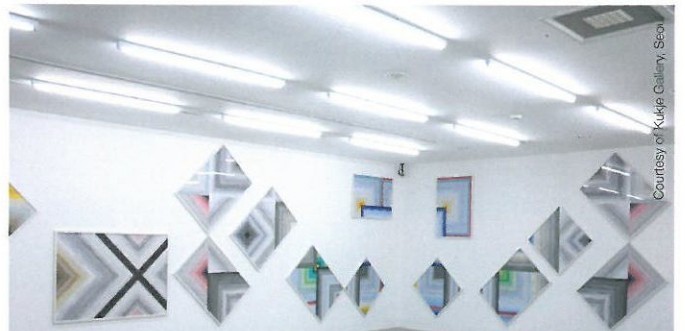
<Diagonal Composition in Flow - Trustworthy #183>, 2012-2013