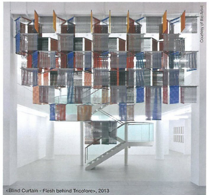
<Blind Curtain - Flesh behind Tricolore>, 2013