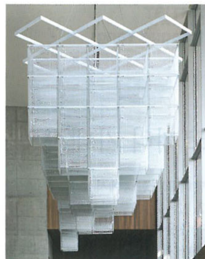
왼쪽 · <진입: 탈-과거시제의 공학적 안무> 2012_카셀도큐멘타 전시 전경 오른쪽 · <솔 르윗 뒤집기-23배로 확장된, 세 개의 탑이 있는 구조물> 2015_삼성미술관 리움 전시 전경