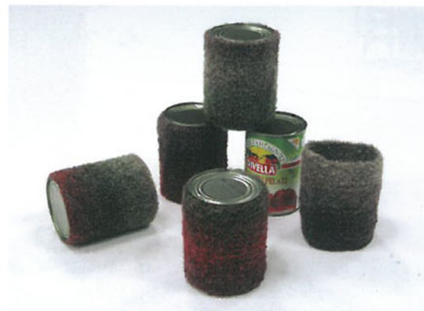
오른쪽 · 〈통조림 코지-토마토 홀 400g〉 토마토 통조림, 털실 각 11×8×8cm 2010

작가 자신에 의한 자기 작품의 모작 내지는 위작이라고 해야 할 〈창고 피스〉는 개념주의적인 작품을 다시 오브제로 제작하는 일을 둘러싼 미학적 난점을 갖고 있는 작품이다. 뒤상이 다시 되살아나서 변기를 리움 안으로 가져와서는 작가 스스로 서명을 해서 전시한다고 해서 그게 〈샘〉(1917)이 되지 않는 것과 마찬가지로 이치다.