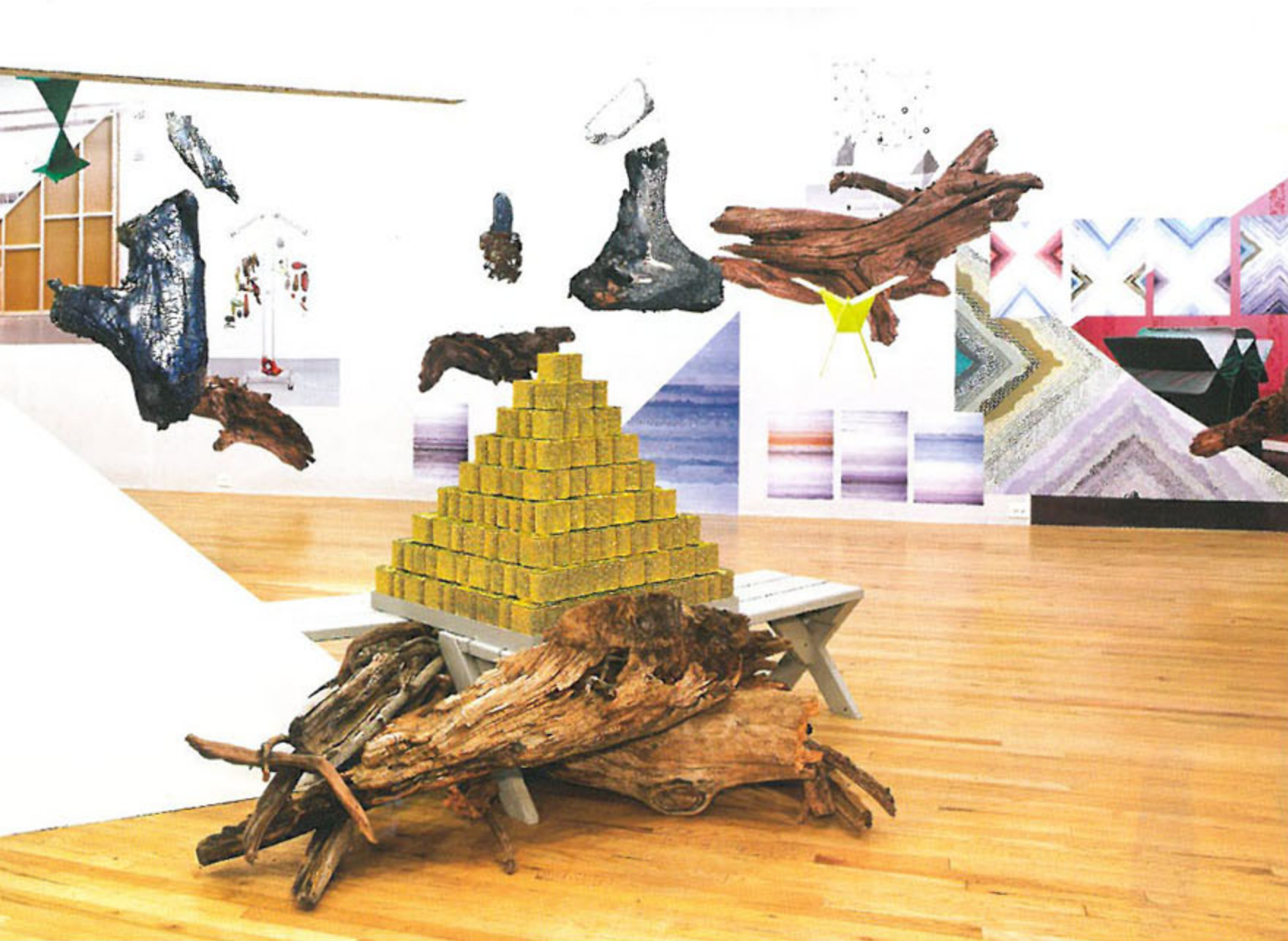
왼쪽 · 〈통조림 코지 피라미드-스팸 340 금색〉 378개의 스팸 캔, 털실, 벤치, 유목(流木) 124.5×243.8×226.1cm 2011_콜로라도 아스펜미술관 전시 전경. 뒤쪽으로 〈신용양호자〉와 괴목 사진 등을 콜라주한 벽지 작업 〈순간이동의 장〉이 보인다.