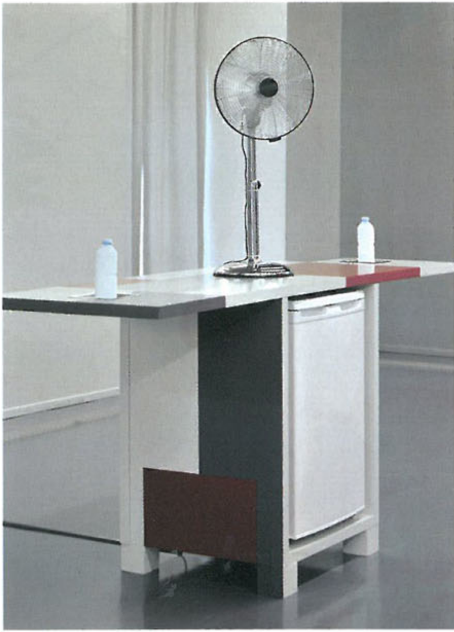
왼쪽부터 · 〈바람과 응결의 현신〉 선풍기, 냉동고, 생수병, 목재 상자 222×232×68cm 2013 / 〈소리 나는 의류〉 2013~15 2013년 홍콩에서 작품을 걸치고 행진하는 퍼포먼스를 선보였다. / 〈상자에 가둔 발레〉 (부분) 2013/2015