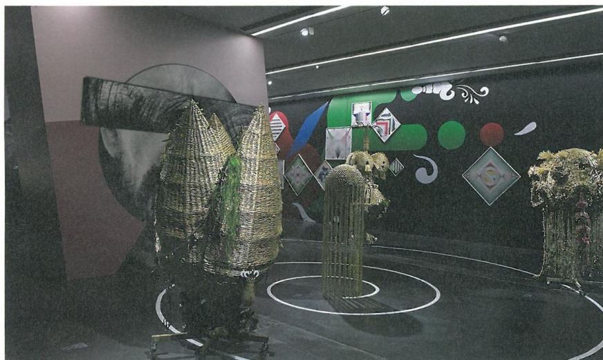
下 梁慧圭《中間類型—海洋蓮花》，綜合材料，215×110×110 cm，2015。