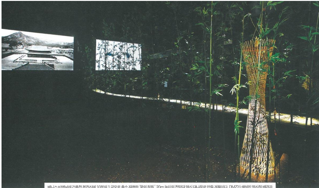
베니스비엔날레건축전 본전시에서 10분의 1 규모로 축소 재현한 '꿈의 정원'. 20m 높이의 전망대 역시 나무로 만들 계획이다. DMZ가 생성된 역사적 배경과 DMZ의 생태계를 보여주는 영상을 나란히 배열해 함께 상영했다.

터뷰를 진행하실 예정으로 알고 있습니다. 영향력이 있다고 하는 건 어디까지나 내가 작가로서 생각하는 것입니다. '꿈의 정원' 자체가 전 세계 누구나 DMZ라는 공간에 대해 생각하고 대화하도록 의도한 프로젝트지요. 이곳은 남과 북을 연결하고 인간과 자연이 공존하는 교감의 장소입니다. 그들이 이 프로젝트에 대해 전하는 메시지를 통해 대화를 보다 풍성하게 만들 수 있었지요. 이 밖에도 할 일이 많습니다. 공중 정원 위에 지름 15~20m에 이르는 원형 휴게 공간이 열 곳 정도 있는데, 그곳에 정자가 들어설 예정입니다. 대기 안에 매설된 지뢰 제거에 대한 이미지도 구체화되어야겠지요. 근처에 있는 공예도성을 복원할 계획안도 구상하고 있습니다. 이 모든 걸 실제로 가능하도록 현실화하는 것이 제 목표입니다. 오랜 시간이 필요한 프로젝트입니다. 혼자 힘으로 할 수도 없는 일이고요. 남과 북뿐 아니라 여러 나라 작가들이 협업했으면 합니다. 독일에서는 통일 전에 많은 작가가 분단에 대한 작업을 했습니다. 동서 길이가 총 250km에 달하는 광대한 지역인 DMZ에 다양한 작가가 각자의 방식으로 작업을 선보이는 걸 상상해보세요. 얼마나 멋있을까요? DMZ라는 공간이 그렇게 바뀌길 바랍니다. 변화를 이끄는 데는 때로는 정치보다 문화적 접근이 훨씬 유연하고 빠를 수 있습니다.