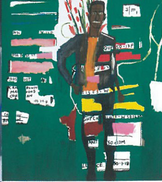
DESMOND_1984 © The Estate of Jean-Michel Basquiat ADAGP, Paris, ARS, New York