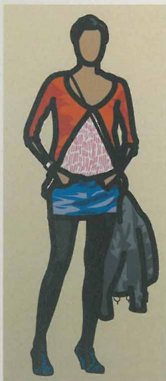
Woman wearing black tights with her hands in her pockets and her jacket hung from her shoulder bag. 2013