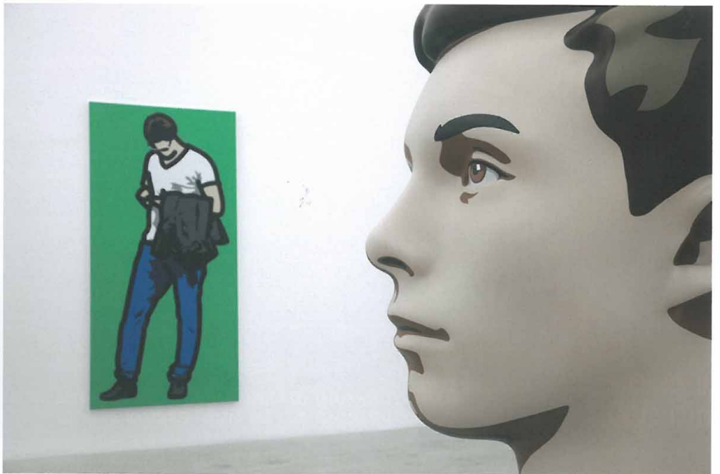
(Right) Julian Opie Finn. 2014. Paint on resin 200 x 121 x 142(cm)