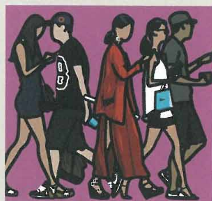
Walking in Sinsa-dong 1. 2014