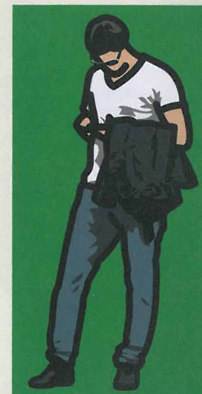
Man wearing dark glasses, texting with his jacket over his arm. 2013