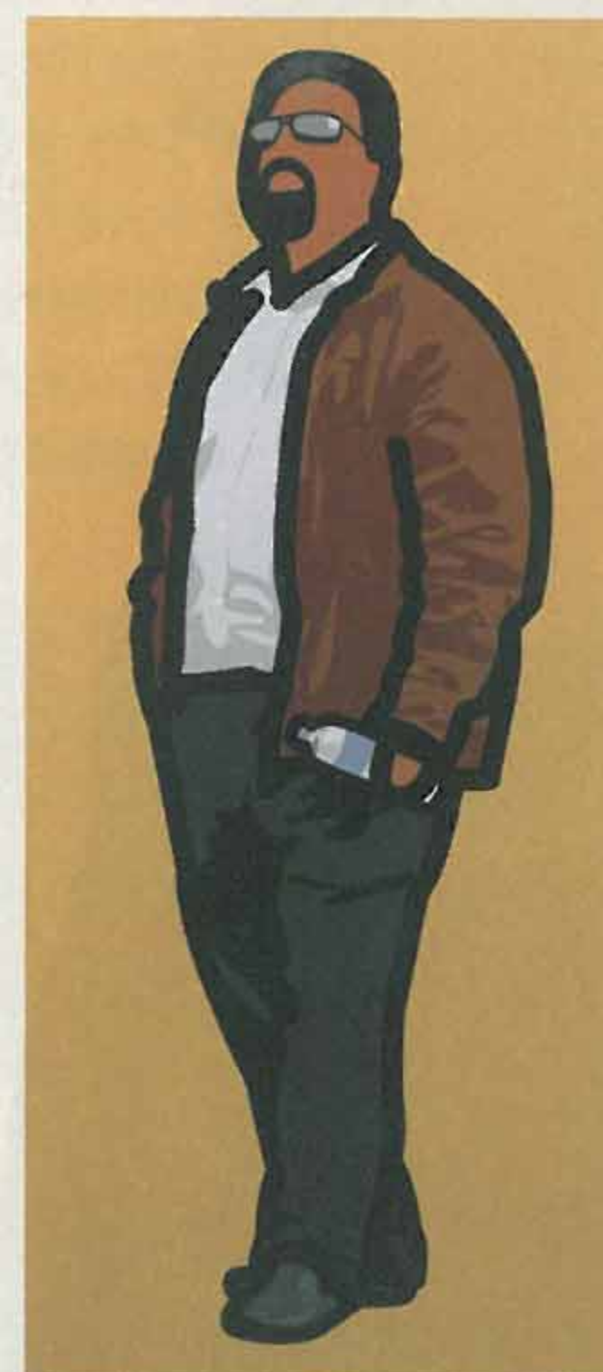
Man with a beard and dark glasses holding a water bottle. 2013