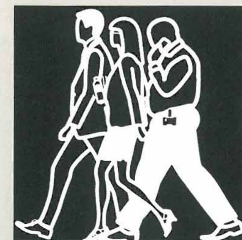
People 2 (square). 2014