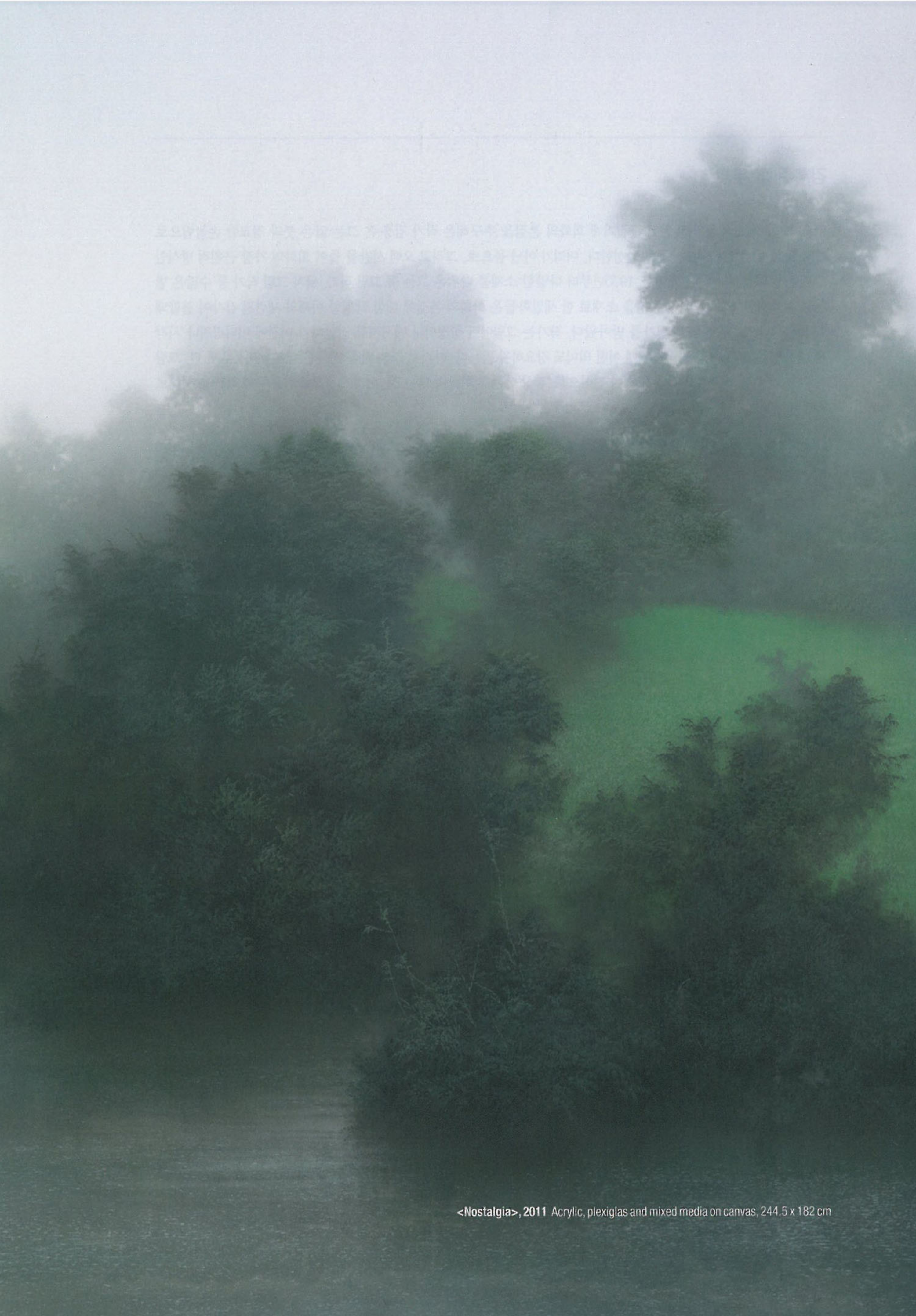
<Nostalgia>, 2011 Acrylic, plexiglas and mixed media on canvas, 244.5 x 182 cm