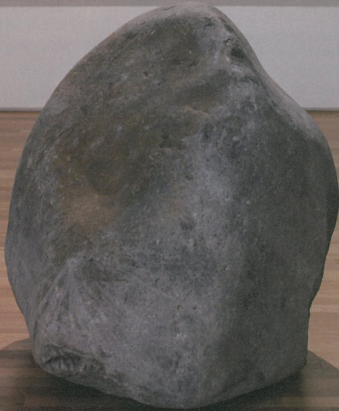
빈 캔버스, 그리고 커다란 돌 하나. 2015년 작품인 〈대화〉, 캔버스와 돌 사이, 그 둘의 조용으로 채워진 공간은 지금 나에게 어떤 파장을 일으키고 있는가.