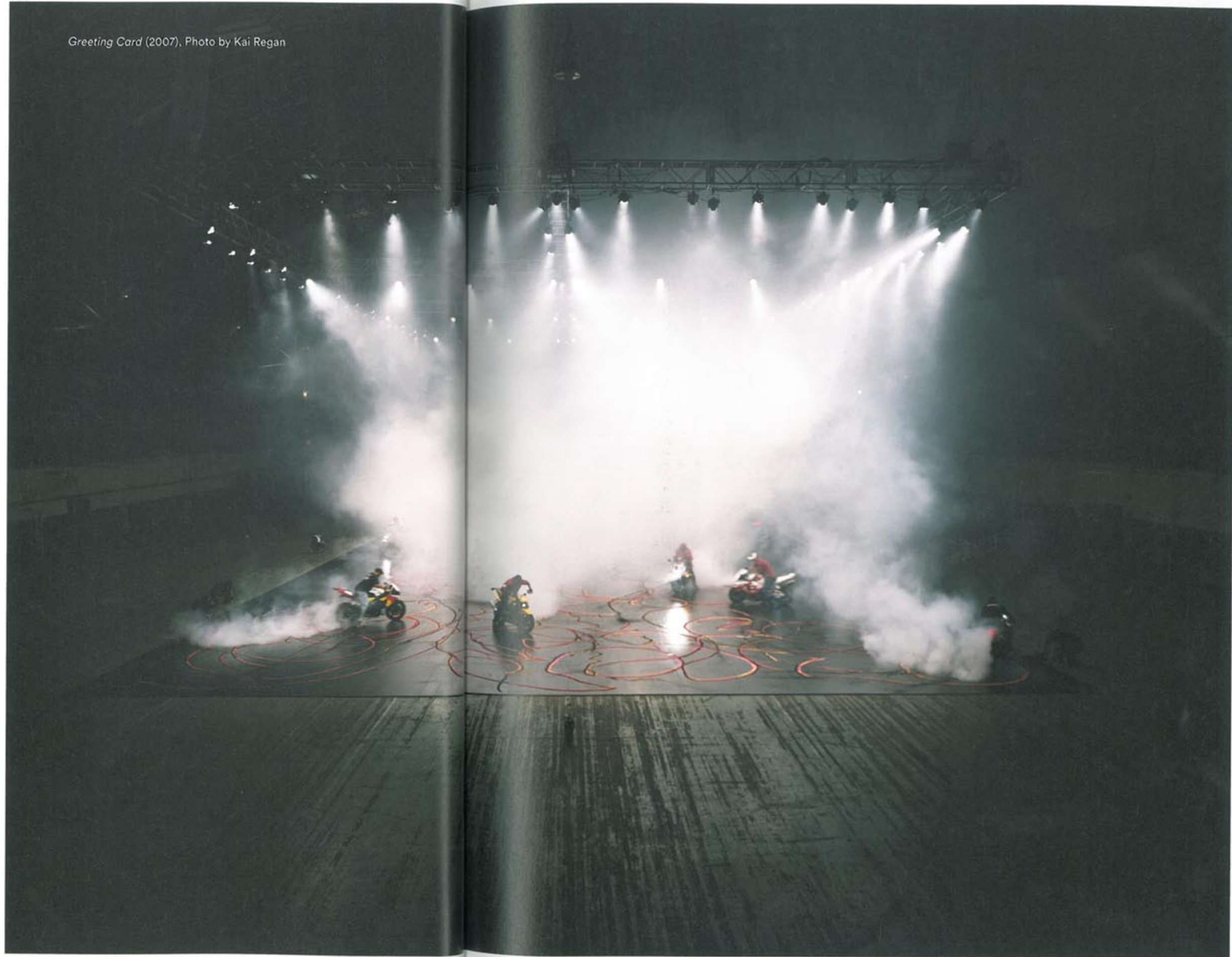
Greeting Card (2007)

가장 좋았던 곳은 어디였는가? 가장 기억에 남는 것은 런던의 서펜타인 갤러리다. 절친 네이트 로먼과 나는 이 갤러리 메인 공간의 천장을 용접했다. 태우기 전과 완전히 달라져 버렸으니, 우리는 천장에 영구적인 작품을 만든 셈이다. 그날 밤에 나가서 즐기느라 비행기를 놓쳐 다음 날 뉴욕에서 열린 개인전에 늦기까지 했다. 기억에 남는 사건이다. 아마 내가 가장 좋아하는 기억이 될 것 같다.