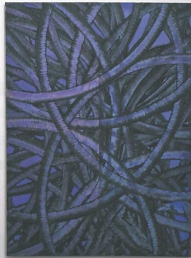
Exhibition view, Kukje Gallery (2013), Photo by Keith Park