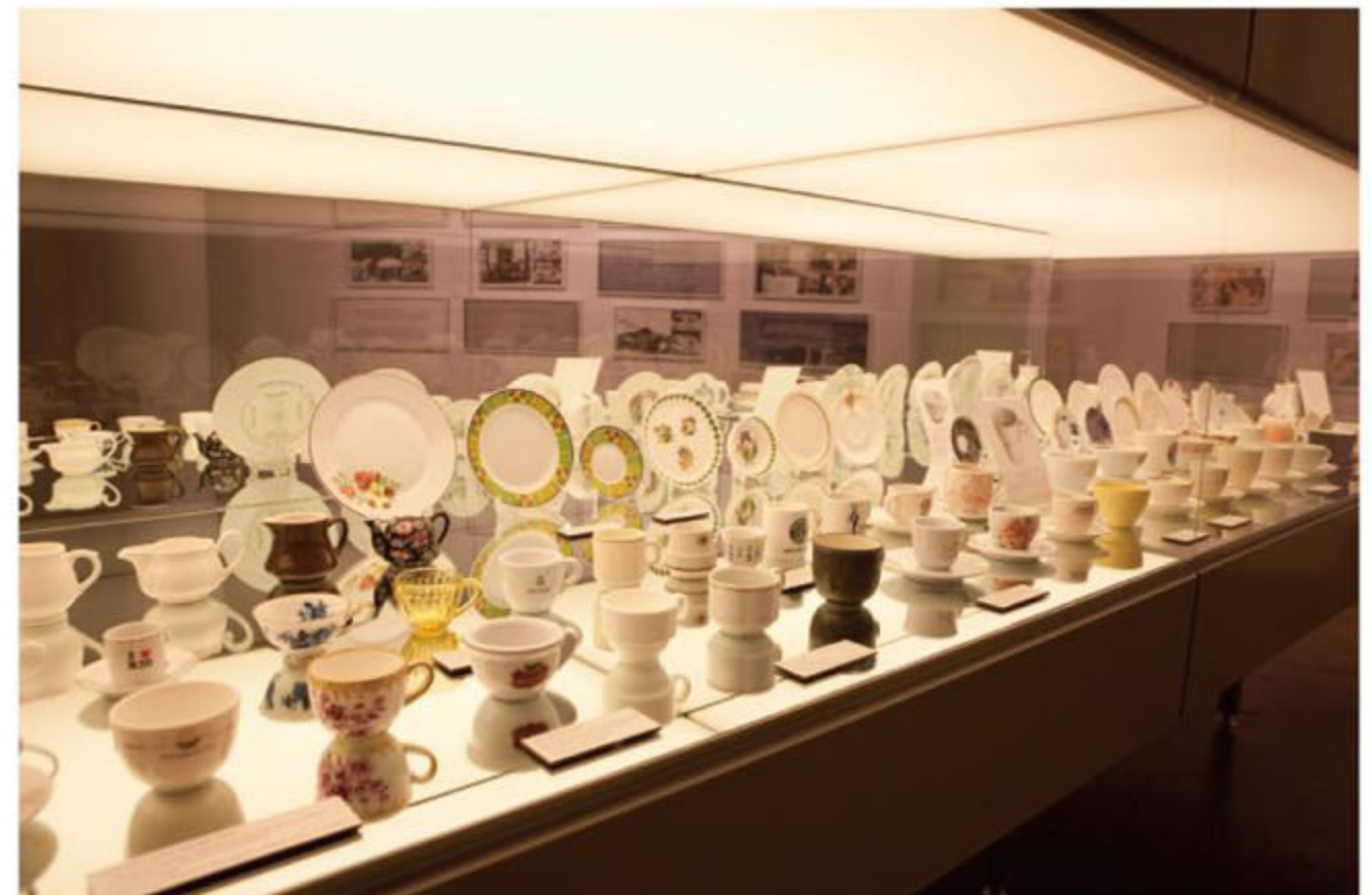
Kyungah Ham, Museum Display , Installation View at Museum Moderner Kunst Stiftung Ludwig Wien in 2010, Stolen objects, brass label, mirror, light, metal, glass, 5×5×2 m, 2000–2010