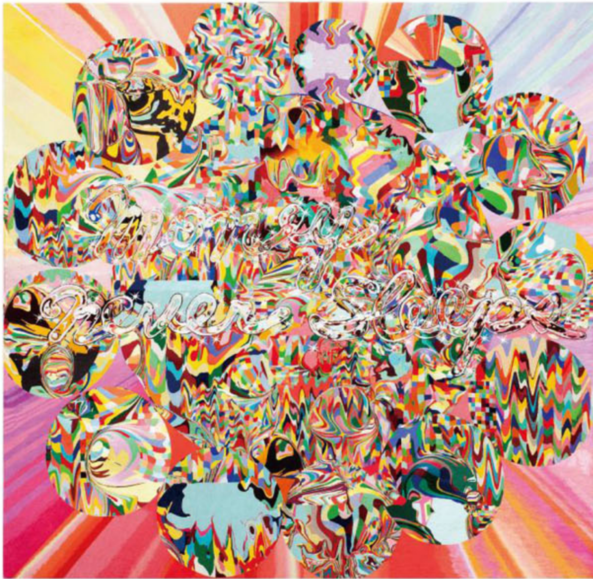
Kyungah Ham, Needling Whisper, Needle Country / SMS Series in Camouflage / Money Never Sleeps C01-01-01 , North Korean hand embroidery, silk threads on cotton, middle man, anxiety, censorship, wooden frame, approx. 1200hrs/ 2persons, 144(h)×145cm, 2014–2015