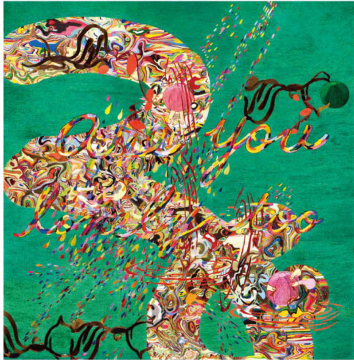
Kyungah Ham, SMS Series in Camouflage / Are you lonely, too? 03 , North Korean hand embroidery, silk threads on cotton, middle man, anxiety, censorship, wooden frame, approx. 1800hrs/2persons, 202(h)×199cm, 2014

것을 좋아할 것 같지만 사실 익숙한 것을 좋아한다. 대다수 사람은 편견에 지배당하는 거 같다. 작가가 이런 작업을 왜 하게 되었는지 자세히 살펴보면 사실은 쉽게 판단하기는 어려운 일이 아닌가. 그러니 너무 쉽게 자신을 믿지 말라고 말하고 싶다.