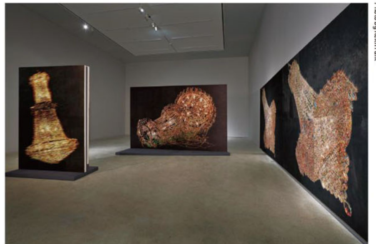
Kyungah Ham, Installation View K3