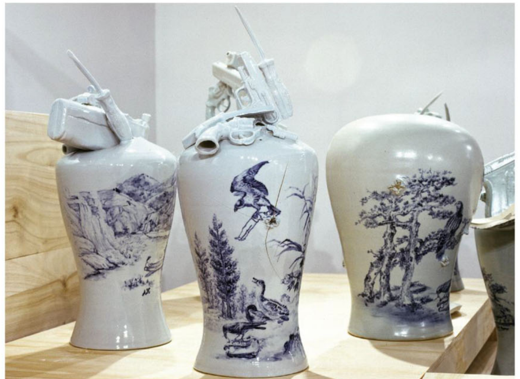
Kyungah Ham, Trophies , Installation View at Art Sonje Center in 2009, Blue and white porcelain, drawing of traditional landscape, Adolf Hitler's painting, wood, Dimensions variable, 2008

Ham: I do not. At times, skeleton-like images do come back to me, but each case differs. Sometimes text works may be problematic, so I simplify the text. I create an abstract image by making a camouflage. Works like At First, it is the Dark met with problem after problem. I expressed a middle man to proceed on a task the workers said was arduous. It was also difficult to pass inspections from Sinuiju. All