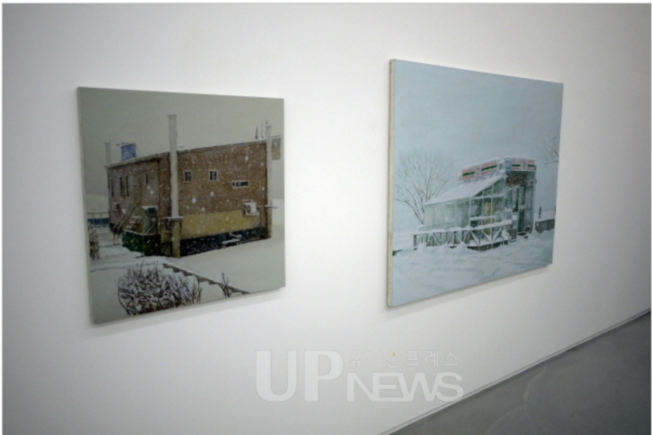
▲ 노충현의 '살풍경' 시리즈

전시 주제는 쓸쓸하고 고요한 정경이라는 의미의 '살풍경'이다. 노충현 작가가 소재로 삼은 장소는 서울시내 한강이다. "심리적으로 힘든 시절 스산한 풍경들이 제게 다가왔습니다. 그때 홍대 근처에 살았는데 시끄러운 홍대와 달리 한강을 보면 마음이 편해졌어요. 시야도 확 트여있었고요."