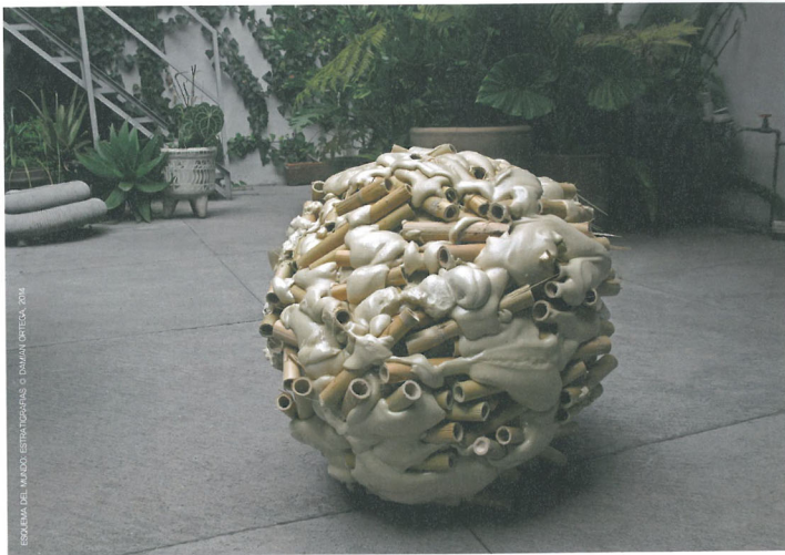
ESQUEMA DEL MUNDO ESTRATIGRAFICO © DAMIAN ORTEGA 2018