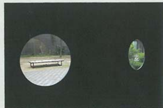
The installation view of Hong Seunghye's works in Kukje Gallery

depending on the viewer's perspective looks like it is being tangled together and creates a new geometric figure. Other works follow the same pattern. The work of the aluminum panel in the shape of a drawer was planted as a surface for a piece of furniture and was now made into actual furniture, and a circular frame which was a geometric factor was placed on the wall of the exhibition, transforming it into a factor of the space. Also, it is meaningful that Hong Seunghye's past works are created into different versions in this exhibition. On & Off is a reinterpretation of 2008's red painted tree into a black steel frame. Pieces fell to the floor from the wall , MORE INTERESTING THAN ART became pixelated and was shortened into MORE . 'I want to tell the story of matter that has to change through geometric shapes. If my previous works expanded from 2D to 3D, this exhibition added in the flow of time', said the artist. This exhibition includes two-dimensional works, sculptures, and videos, and is opened until August 17. <by Park Gye Hyun>