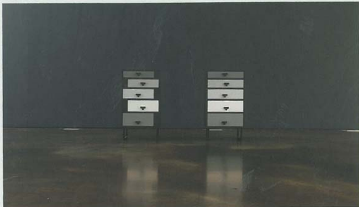
Hong Seunghye, Dancing Drawer , Polyurethane on birch plywood, 35 × 43.2 × 79.8cm (each), 2014

인지하게 되고 시선의 각도에 따라 또 다른 형태가 드러난다. 그는 "원래 2차원에 선으로 그렸던 이미지에 높이를 주면서 3차원의 조각으로 만들었다"고 말했다. 그가 생각하는 기본 형식인 그리드 내에서 그려진 선은 관람객의 시선에 따라 얽혀 보이며 새로운 기하학적 도형을 만들어낸다. 그 외 작품도 마찬가지다. 서랍 모양의 알루미늄 패널 작품은 가구의 입면으로 차용돼 실제 가구로 제작됐고 하나의 기하학적 요소였던 원형 프레임은 전시장 벽에 타공되어 공간 구성 요소로