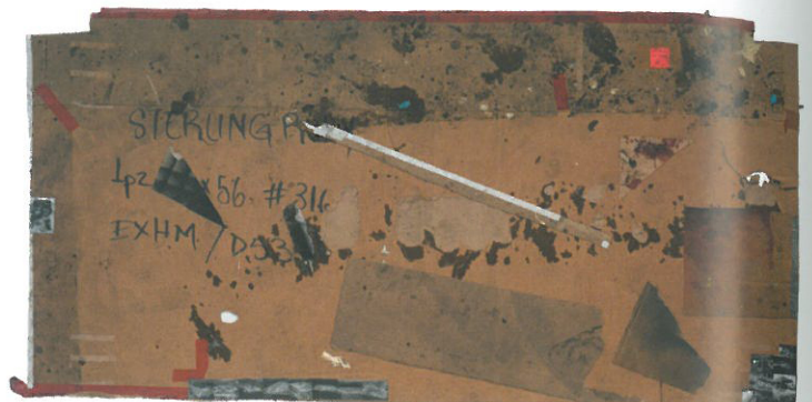
'EXHM(3682)', collage and urethane on cardboard, 171.5×328.9×6.4cm, 2012

이번 전시를 통해 소개된 스틸링 루비의 작품 세계를 함축해보자면 주변화에 대한 이해에 따른 회복을 가장 주요하게 들 수 있다. 사실 그의 작품이 지니는