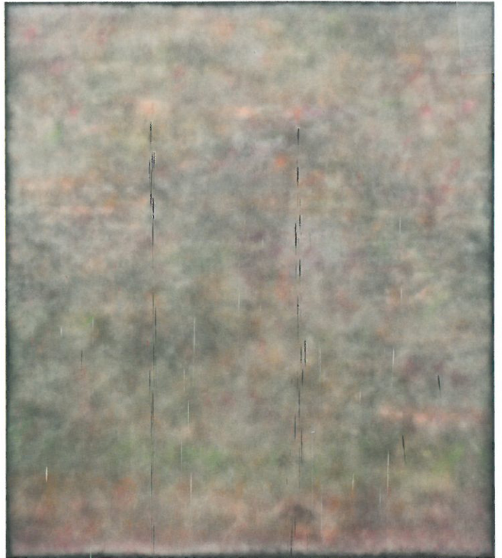
'SP235', spray paint on canvas, 254x365.8x5.1cm, 2013

매일 밤 갱들의 영토 싸움이 끝나고 나면 다운타운 시가지의 벽들은 온갖 색상의 스프레이 흔적이 중첩되어 '스프레이 회화들이 되어버린다. 더욱 흥미로운 점은 시청 측에서 아침이 되면 모든 벽면을 말끔히 하얗게 복구해버린다는 것이다. 루비는 이를 깨진 유리창 이론(유리창이 깨지면 이를 얼른 치워놓아야 반복되는 부정적 영향을 막을 수 있다는 것)에 빗대어 관찰했다.