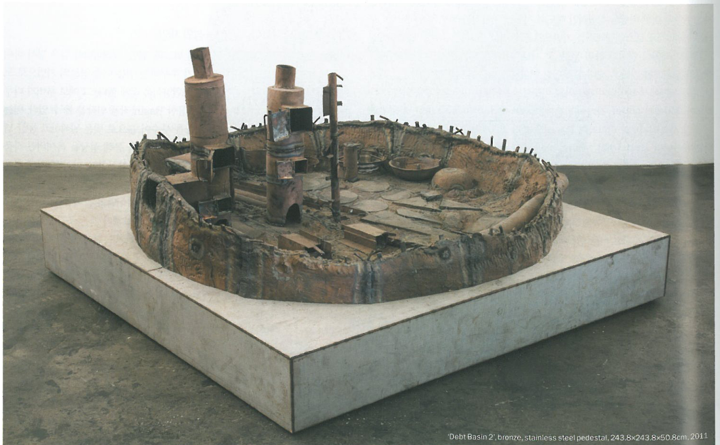
'Debt Basin 2', bronze, stainless steel pedestal, 243.8×243.8×50.8cm, 2011

스틸링 루비의 개인전은 5월 10일까지 국제갤러리 전시장 3관과 1관에서 열린다.