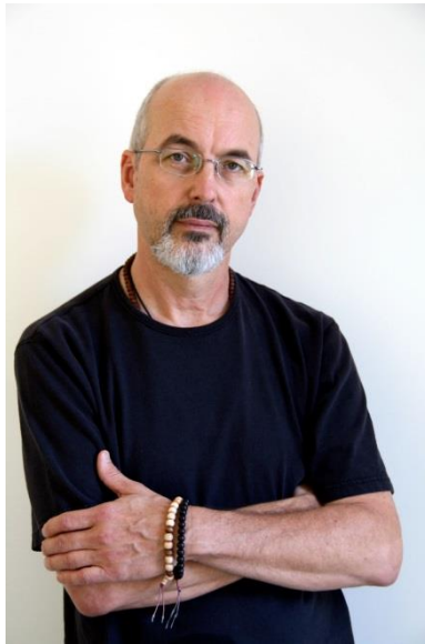
Portrait of Bill Viola

빌 비올라는 1951년 뉴욕에서 태어나 시라큐스 대학교를 졸업하였다. 1995년 베니스 비엔날레에서는 미국관을 대표하는 작가로 선정되어 세계적인 주목을 받았다. 주요 개인전으로는 1997년 미국 휘트니미술관의 «빌 비올라: 25년간의 연구», 2003년 미국 폴 게티미술관의 «욕망», 2006년 일본 모리미술관의 «첫 번째 꿈», 2008년 팔라쵸 델 에스포시치오니와 2014년 파리 그랑팔레에서의 개인전 등이 있다.