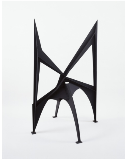
Alexander Calder (1898 – 1976) Morning Cobweb [intermediate maquette] 1967

sheet metal, bolts and paint 64 x 40 1/4 x 40 inches 162.6 x 102.2 x 101.6 cm