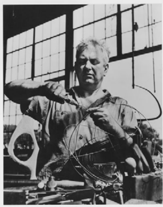
© 2012 Calder Foundation, New York / Artists Rights Society (ARS), New York

알렉산더 칼더는 1898년 미국 필라델피아에서 조각가의 손자이자 아들로 태어났다. 본래 기계공학을 전공한 뒤 다양한 직업을 전전했던 그는 1923년 뉴욕 아트 스튜던츠 리그에 입학하여 4년 간 회화를 전공하였다. 1926년 프랑스 파리로 이주한 작가는 나무와 철사를 사용해 움직이는 장난감과 조형물을 제작하기 시작했고 ‘칼더의 서커스’라 명명된 작품으로 유명세를 타기 시작한다. 1928년 뉴욕 베이헤 갤러리에서의 첫 개인전 이후 1928년부터 1933년까지 주로 파리에 거주하던 칼더는 호안 미로와의 교우 관계를 통해 중요한 영향을 받게 된다.