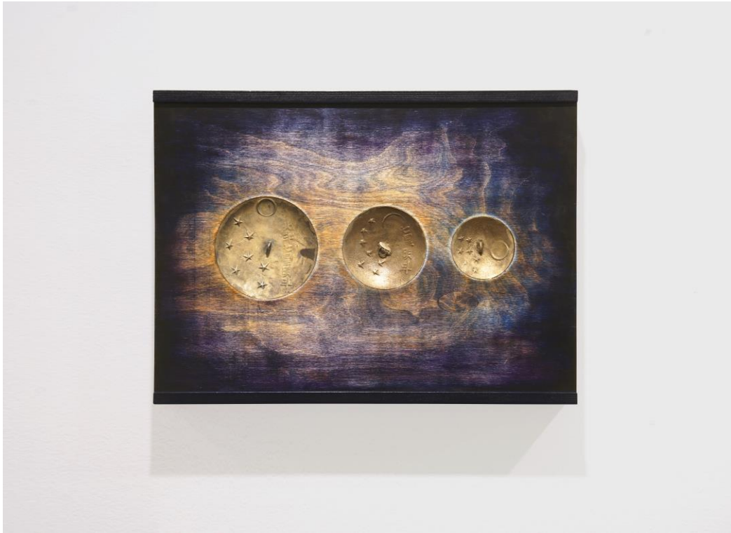
《小星星5》(Bright Stars 5), (背面图)