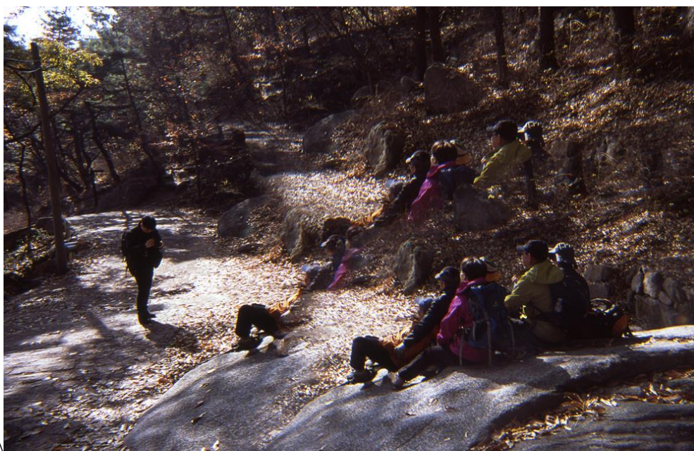
《走向僧伽寺的路》(Way to the Seung-ga Temple)